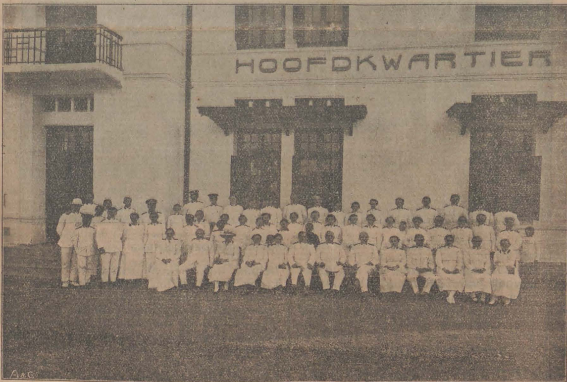
KOLONEL & MEVROUW CUNNINGHAM MET EEN GROEP OFFICIEREN, DIE AAN HET CONGRES IN 1921 DEELNAMEN.